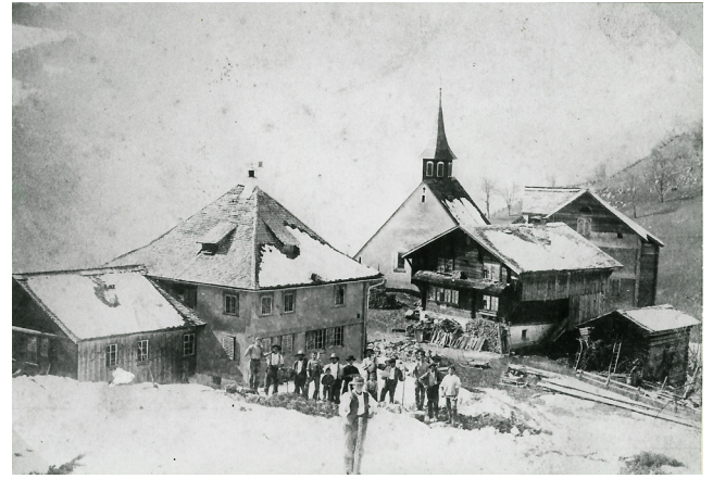
Ein Bild aus dem Jahr 1892 – aus dem Archiv von Hanny Heinzer.