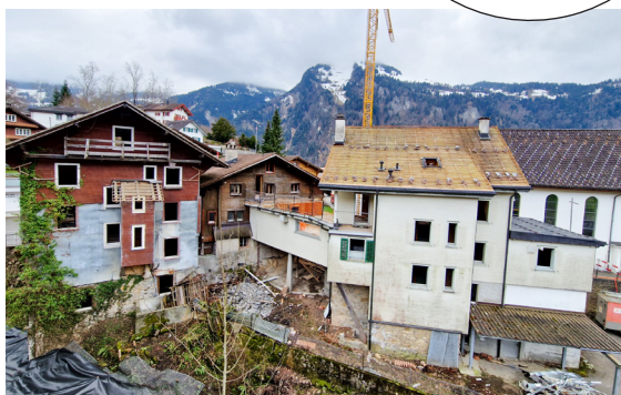
27. März 2025

Ein Rückblick auf die Abbruch- arbeiten: