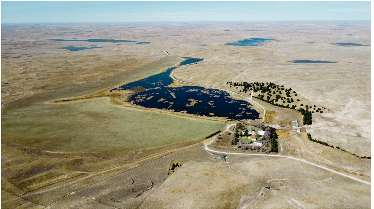
▲ Die Ranch umfasst eine sehr grosse Fläche, dementsprechend sind die Distanzen nicht mit unseren zu vergleichen.

sätzlich das ganze Jahr im Freien gehalten werden.