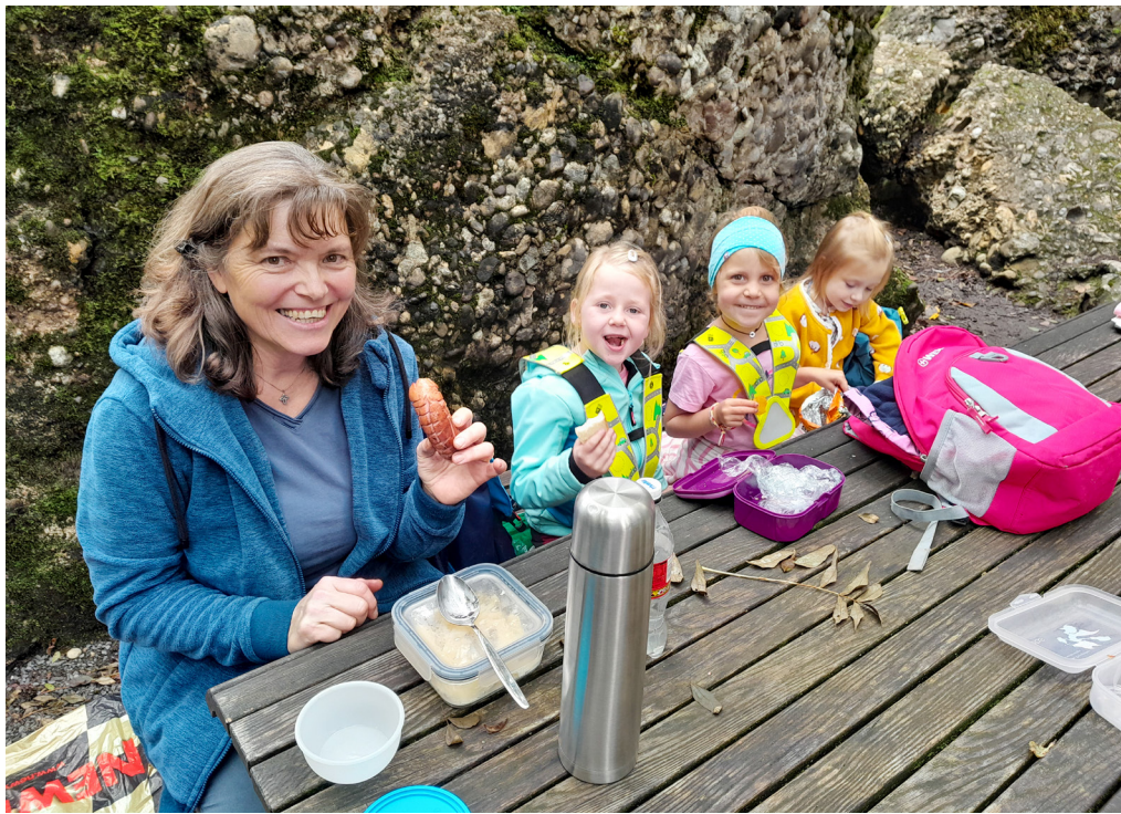
◀ Auf der Kindergartenreise im Tierpark

Kindergärtnerin, die Handarbeitslehrerin und die Religionslehrerin/Hr. Pfarrer. Damals gab es keine Schulleitung und auch keine IF-Lehrperson (Integrierte Förderung). Die Schulklassen waren grösser als heute. Ausserdem war der Kindergarten noch freiwillig. Der administrative Aufwand war bedeutend kleiner als heute. Allgemein war mehr Ruhe im Schulbetrieb, heute gibt es viel mehr Schulreformen. Auch hatten wir im Schulhaus weder einen Kopierer noch einen PC – die Elternbriefe wurden auf einer Schreibmaschine getippt und mit «Schnapsmatritzen» vervielfältigt. Im Kindergarten hatte das Spielen, vor allem das Freispiel einen sehr hohen Wert. Heute müssen wir Kindergärtnerinnen Sorge tragen und uns einsetzen für die Kinder, damit das freie Spielen nicht zu kurz kommt und der Kindergarten nicht verschult wird. Ich bin überzeugt, dass die Kinder beim Spielen sehr viel lernen fürs Leben, zum Beispiel warten können, Rücksicht nehmen, sich durchsetzen, aber auch kreativ sein, Selbstvertrauen aufbauen, kognitiv, grob- und feinmotorisch. Beim Spielen lernen und entwickeln sich die Kinder ganzheitlich.