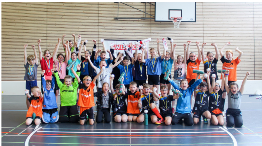
Fünf Schülerteams kämpften am Jaglions Cup um den Sieg.

Die Plauschmannschaften zeigten spannende Spiele.