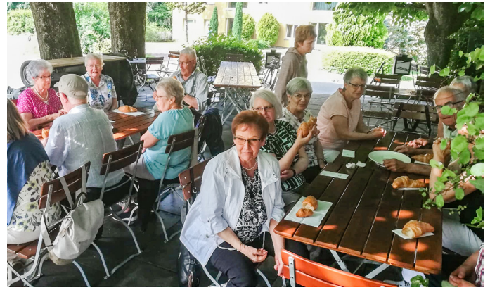
Die Senioren beim Kaffeehalt im Restaurant Isebähnli. Das Restaurant ist ein beliebter Treffpunkt für Motorradfahrer.